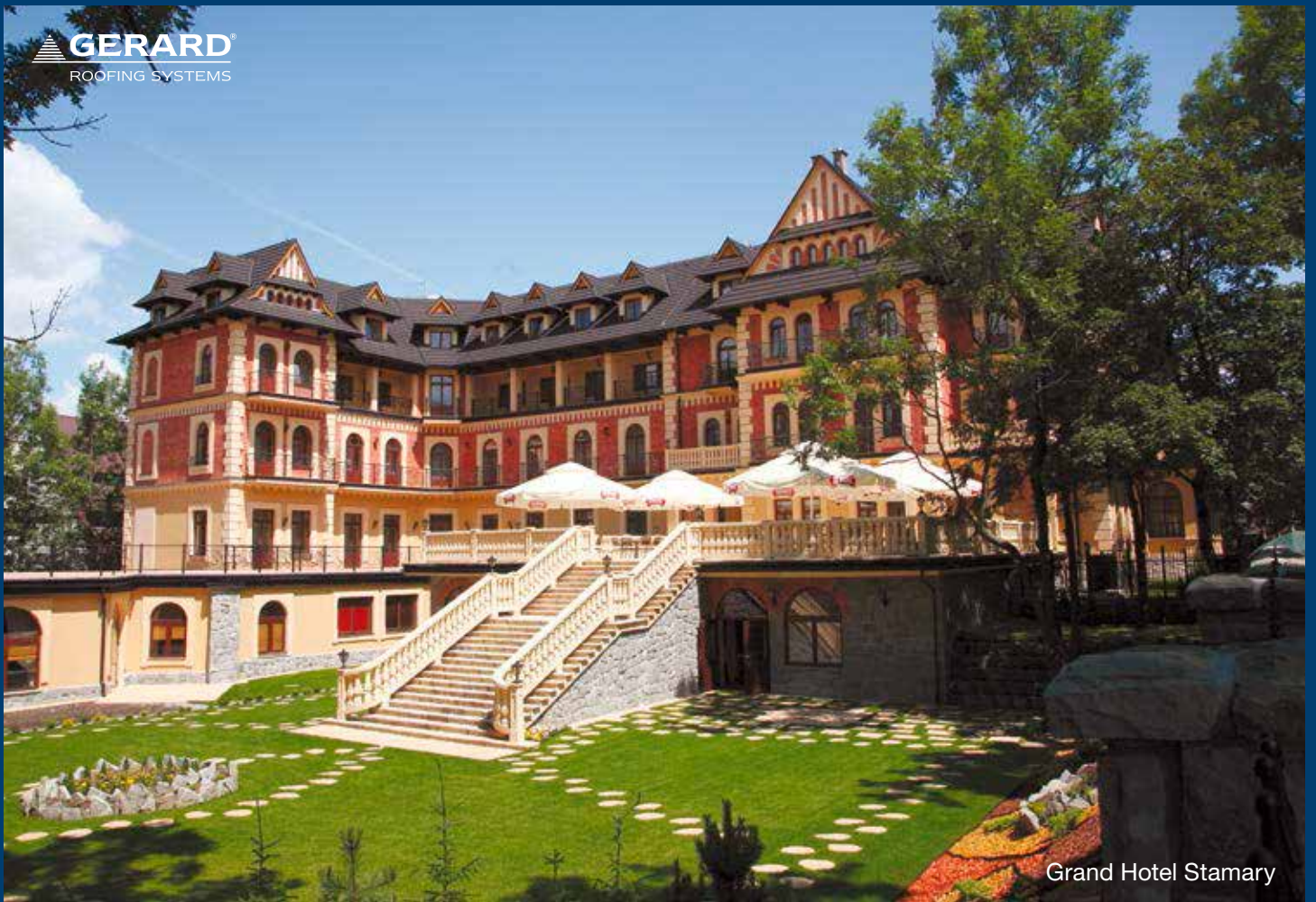
Grand Hotel Starmary

OD 1957 roku firma GERARD, Nowo Zelandzki wynalazca Blachodachówki z posypką z naturalnej skały wulkanicznej, pokrył setki tysięcy dachów w ponad 120 krajach. W Polsce 25 lat pracy uczyniło nas liderem, tego rodzaju pokrycia a na Podhalu staliśmy się synonimem dachu, mając już blisko 10.000 domów pod Gerard-em.