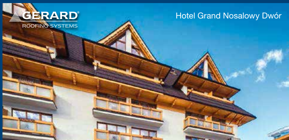
Hotel Grand Nosalowy Dwór

Oferujemy Państwu wszystkie wymienione zalety wraz z 50 letnim okresem Gwarancji Producenta.